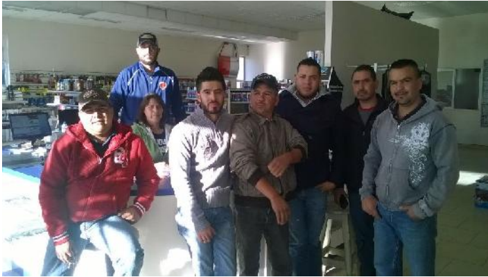
Parte de nuestro personal de sucursal Auto Home Express