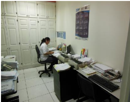
Área de auxiliares contables de Grupo Copazhsa