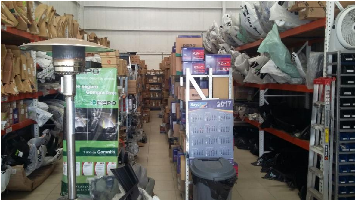
Almacén de Sucursal Allende