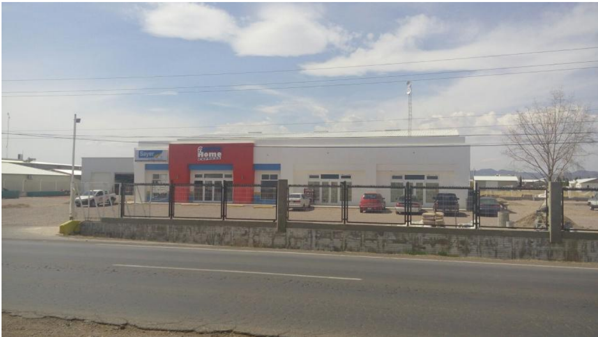
Imágenes de las instalaciones de Auto Home Express.

KM. 6+300 CARRETERA A RUBIO CAMPOS MENONITAS