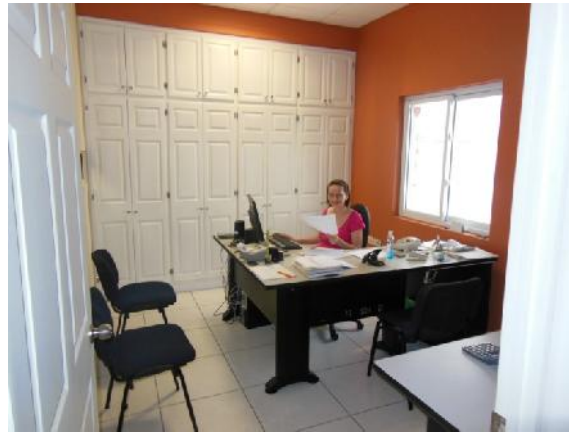
Contadora de Grupo Copazhsa.