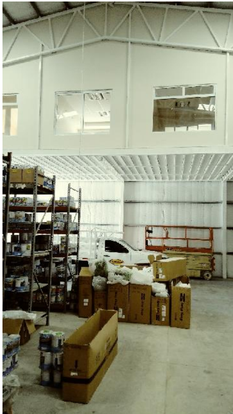
Construcción de nuevas oficinas en Sucursal Auto Home Express