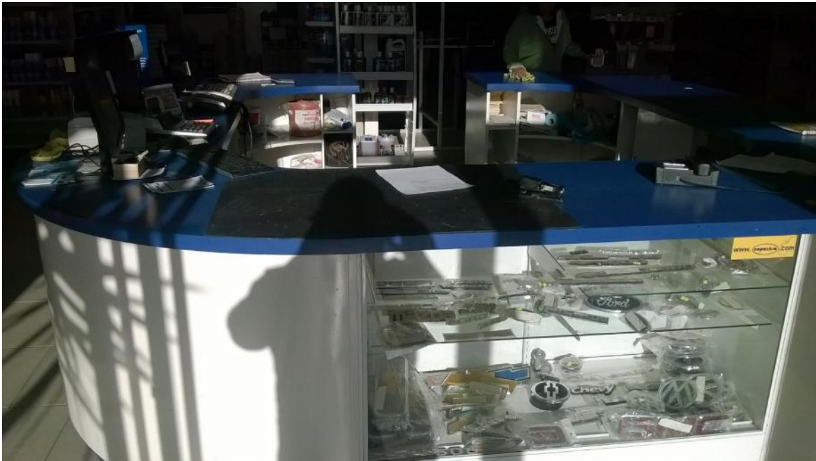
Estas imágenes son del área de servicio y atención a clientes.