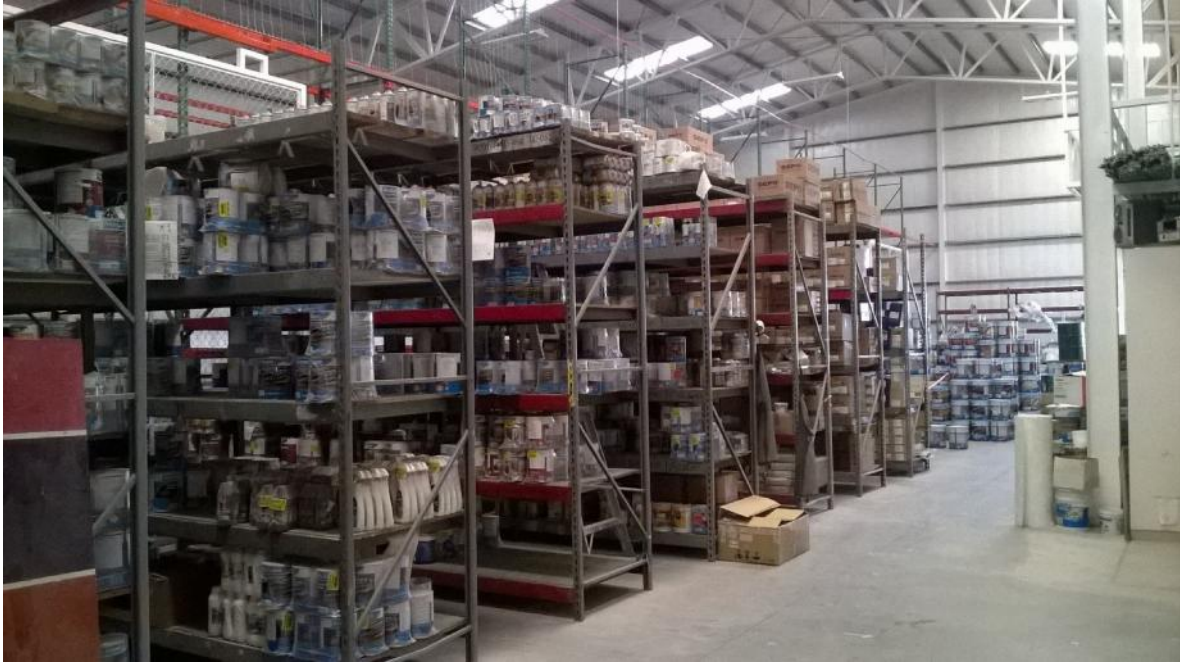
Parte de los almacenes de partes de colisión en Sucursal Auto Home Express.