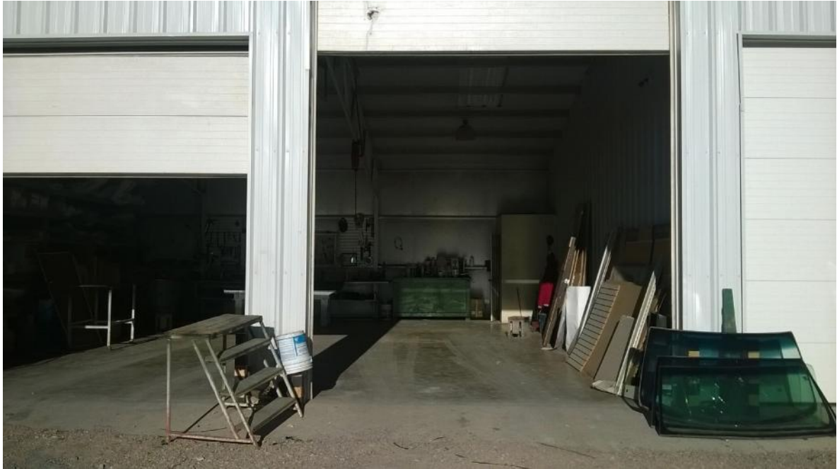
Área de taller de instalación de cristales y accesorios automotrices.