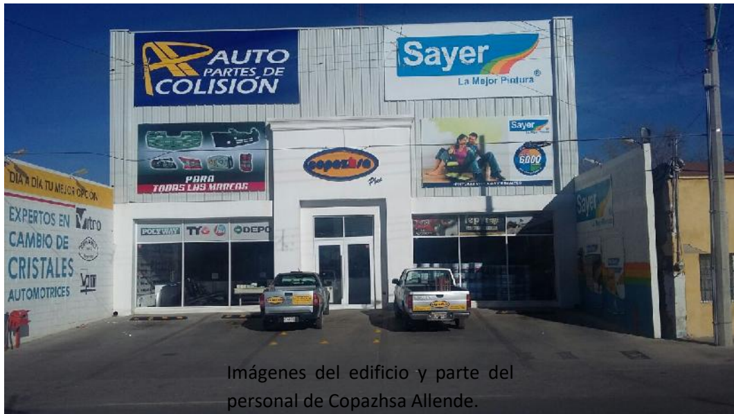
Imágenes del edificio y parte del personal de Copazhsa Allende.

Área de ventas de mostrador y atención a clientes.