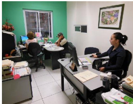
Gerencia de Administración y Recursos Humanos de Grupo Copazhsa.