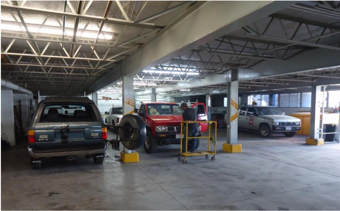
Imágenes de parte del Taller de Instalaciones de Copazhsa Matriz.